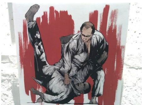
Ил. 3 [22]

его преимущество над Обамой — это превосходство не только в физической силе, но и в интеллекте: на одном из плакатов он показан как более умелый шахматист, чем его оппоненты. Обращает на себя внимание привлечение художниками сюжетов, имеющих сексуальные коннотации, в которых мужественность Путина и ее недостаток у Обамы метафорически представлены как мужская потенция и ее отсутствие. Другой традиционный сюжет, выражающий превосходство мужественности — репрезентации оппонента как ребенка (ил. 4).