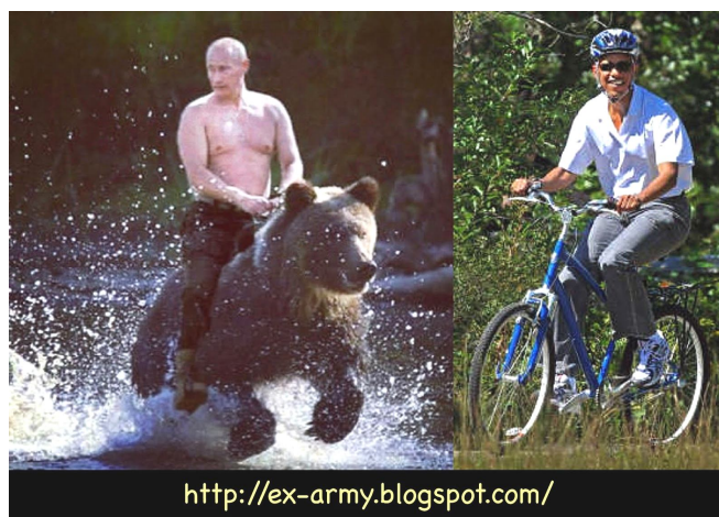
Ил. 1 [20]

Прежде чем характеризовать репрезентации Путина и Обамы в России, следует отметить, что противопоставление двух президентов намного более популярно в американских медиа. Так, в 2012—2013 гг. в электронных медиа публиковались подборки фотографий и коллажей, на которых были противопоставлены два лидера — работающие, отдыхающие, занимающиеся спортом. Российский президент на них был представлен мужественным, решительным и сильным, Обама — слабым и уступающим Путину по всем показателям (ил. 1).